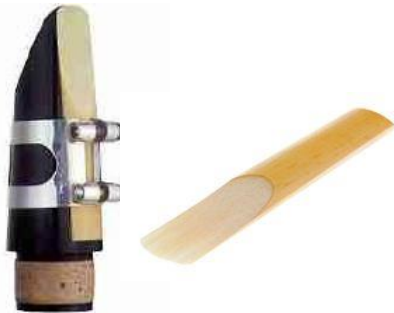
mondstuk klarinet & los riet